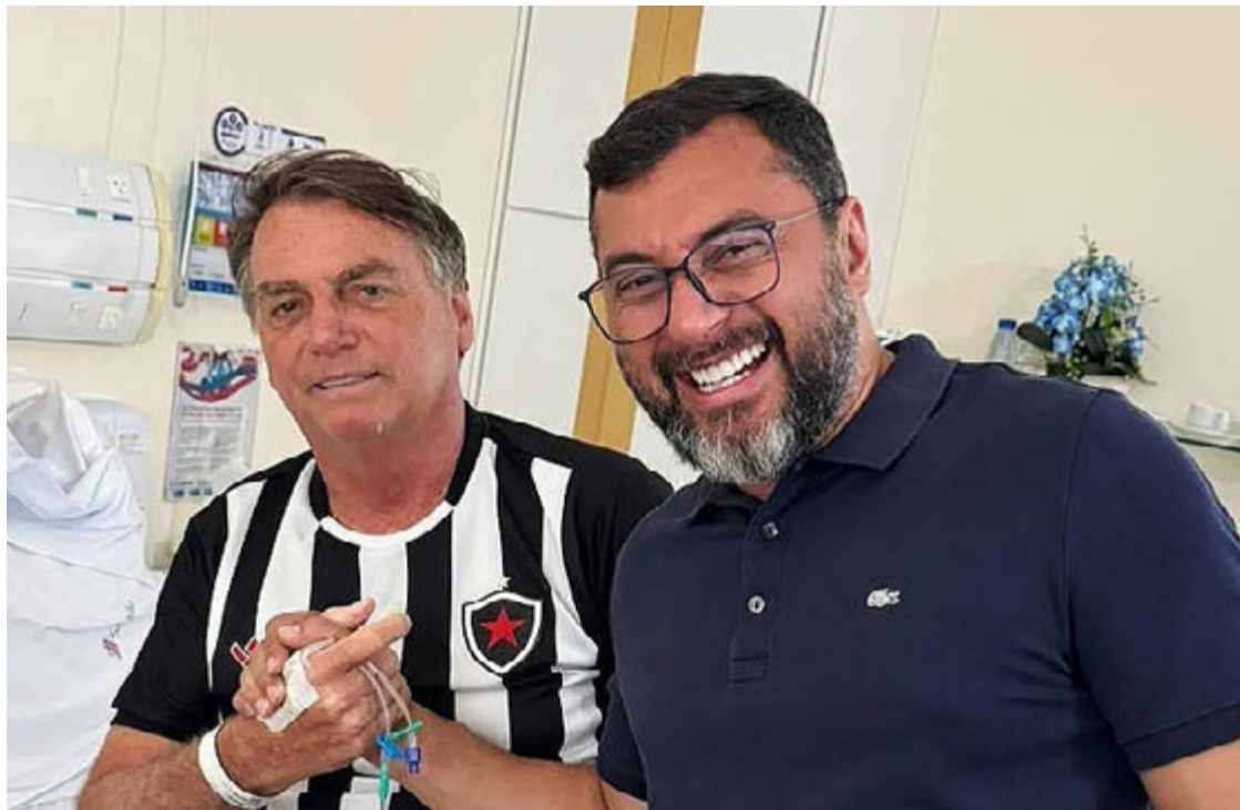
Wilson Lima e Jair Bolsonaro: eleições de 2026 distancia governador e ex-presidente

Já na corrida pela Prefeitura de Campo Grande, no Mato Grosso do Sul, com aval e participação direta do ex-presidente, o PL se aliou ao PSDB no estado e implodiu a aliança com o PP patrocinada pela senadora Tereza Cristina (PP-MS) na ca-