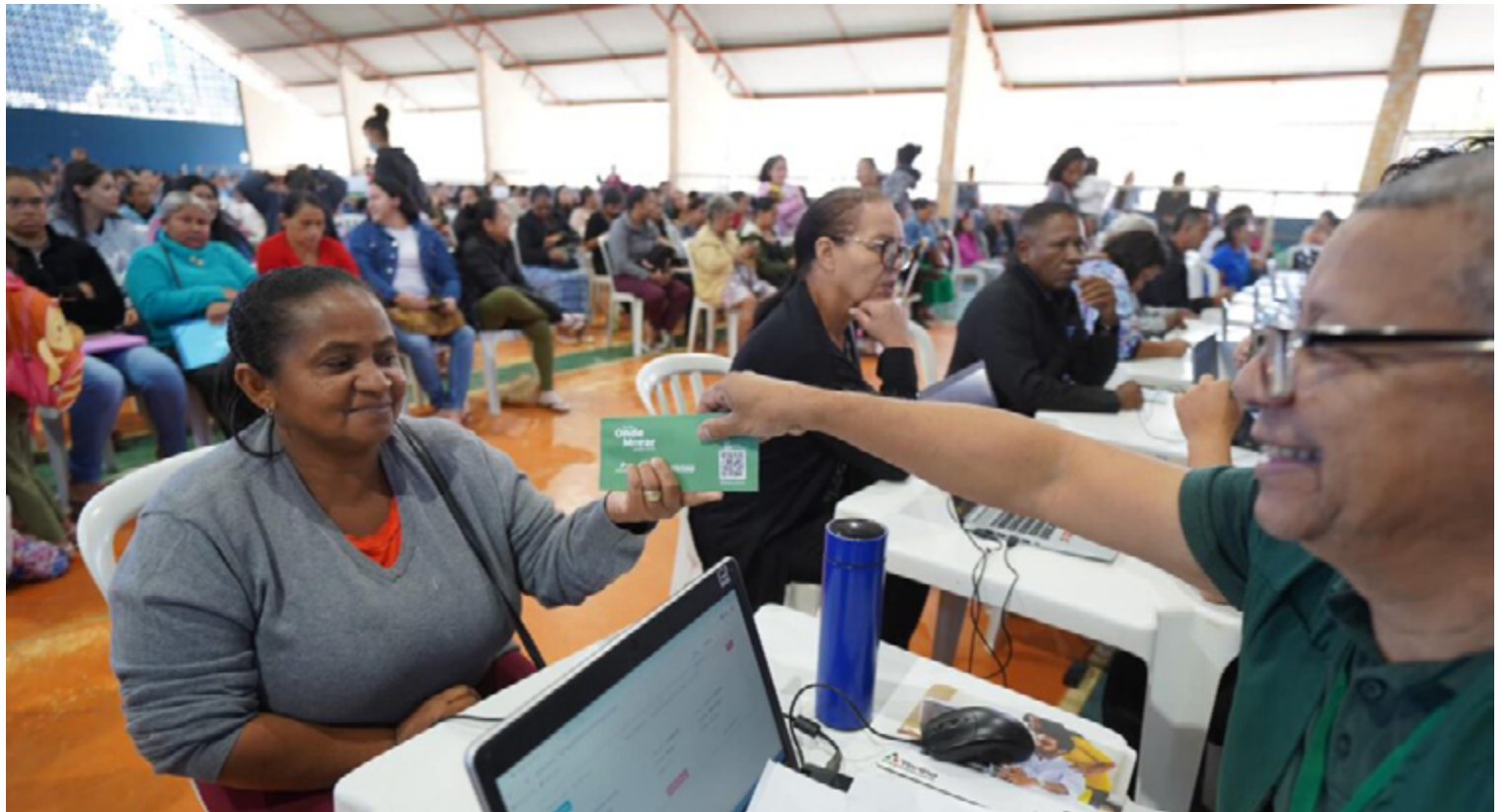
O programa "Pra Ter Onde Morar – Aluguel Social" é uma das várias iniciativas do Governo de Goiás voltadas para a área de habitação social.

O programa "Pra Ter Onde Morar – Aluguel Social" oferece um auxílio mensal de R$ 350, pago durante 18 meses, destinado exclusivamente ao pagamento de aluguel. Essa medida tem grande relevância social, pois alivia significativamente o impacto desse custo no orçamento das famílias beneficiadas, permitindo-lhes direcionar seus recursos para