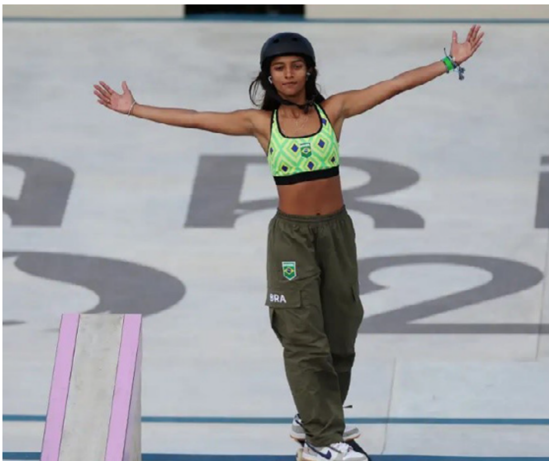
Rayssa Leal conquistou a sua segunda medalha em Olimpíadas

Na final, a brasileira terminou a fase de voltas em quinto lugar, com 71.66. No momento das manobras, o talento falou mais alto. Ela bateu o próprio recorde na segunda tentativa e fez 92.88. Rayssa errou a primeira, a terceira e a quarta tentativas. Na última, conseguiu um 88.83 para garantir o bronze em Paris. Em 2020, nas Olimpíadas de Tóquio, a maranhense Rayssa conquistou a medalha de prata, aos 13 anos. (Com Agência Brasil)