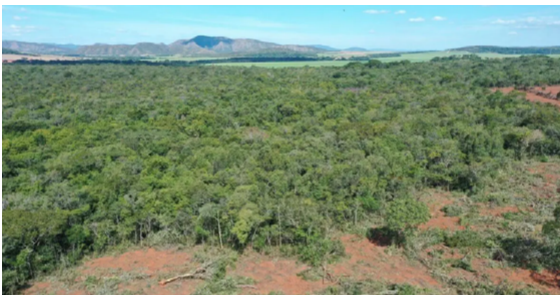
Nenhum município goiano consta entre os cinco com maior área desmatada em 2024

De acordo com o SAD, Goiás é o estado do Cerrado brasileiro em que houve a maior redução no indicador. A região do chamado Matopiba (Maranhão, Tocantins, Piauí e Bahia) continua a responder pela maior parcela do desmatamento no bioma,