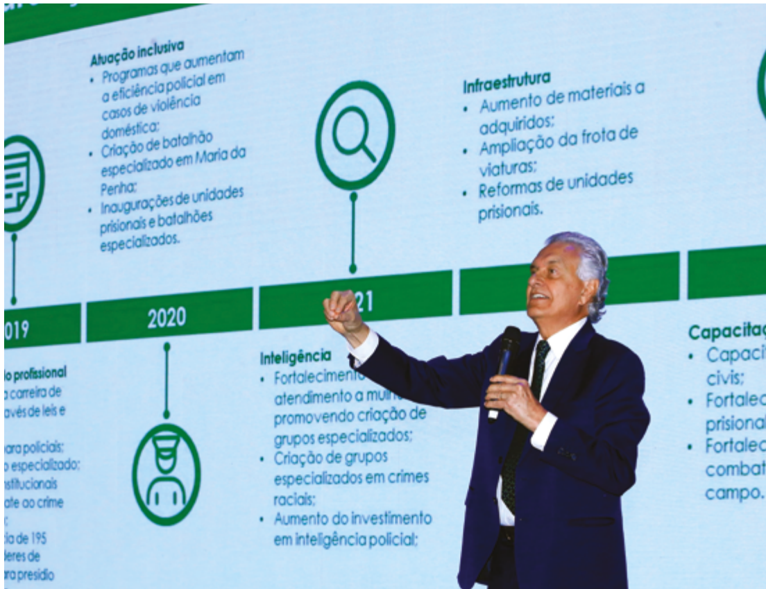
Ronaldo Caiado apresentou, durante congresso, linha do tempo para mostrar a redução da criminalidade