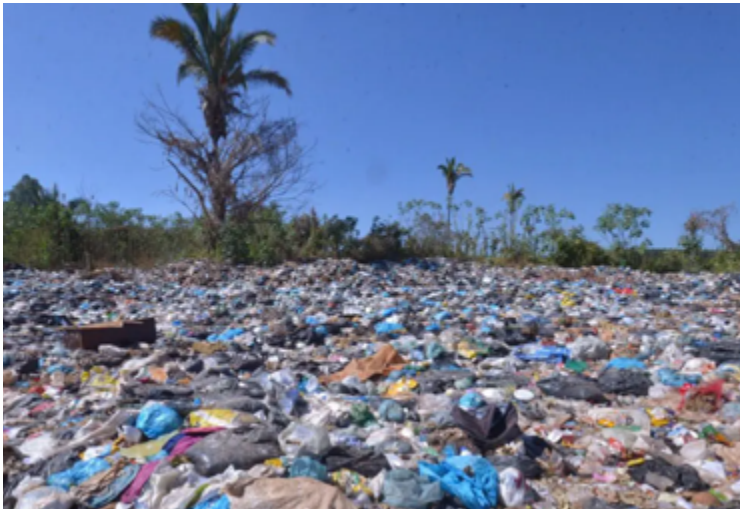
A Semad fez também um estudo sobre a existência de cooperativas de catadores em Goiás e a distribuição delas pelo território

Relatório mostra que 76 municípios de Goiás declararam já ter implementado um serviço de coleta seletiva