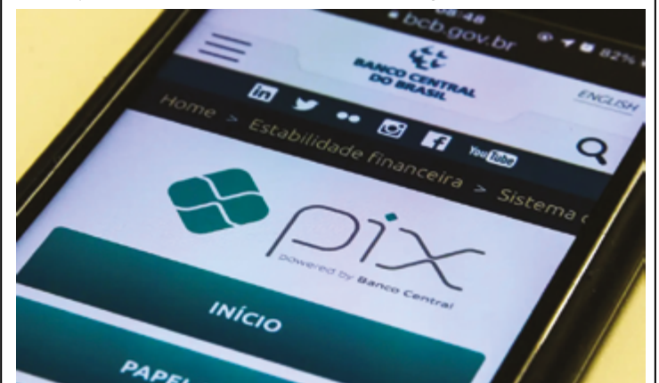
Em algumas situações cota diária não poderá ultrapassar R$ 1 mil

A entidade também impõe que os bancos disponibilizem em canal eletrônico, de acesso amplo para os clientes, informações de cuidados a serem tomados para evitar fraudes. A resolução BCB nº 403, com essa e outras alterações, foi publicada no site da instituição. (Com informações Agência Brasil)