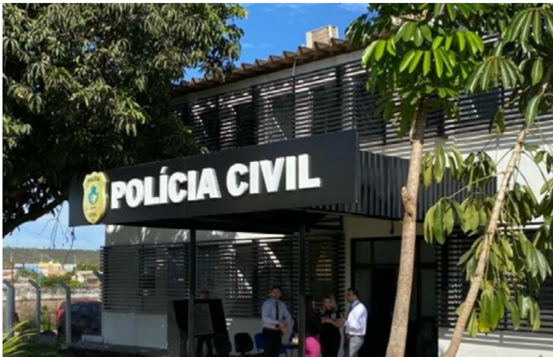
Os irmãos foram detidos e estão agora à disposição da Justiça

De acordo com informações registradas nos autos, no dia do crime, a investigada estava acompanhada de um primo em um bar de narguilé. A vítima e seus familiares chegaram ao mesmo local e decidiram compartilhar uma mesa com a investigada e seu primo. Ao deixar o estabelecimento, um desentendimento entre os homens presentes na mesa, motivado por ciúmes, resultou em uma briga física. Durante o confronto, a investigada afirmou ter sido agredida e ligou para seu irmão,