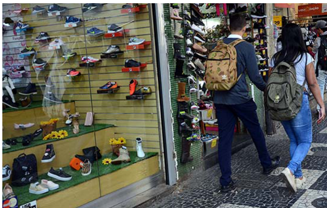
O setor varejista, além de ter o maior número de unidades do estado, também é responsável por empregar 68,9% dos trabalhadores do comércio goiano

peças e motocicletas também apresentou elevação no período analisado. Este é responsável por 10,7% do total