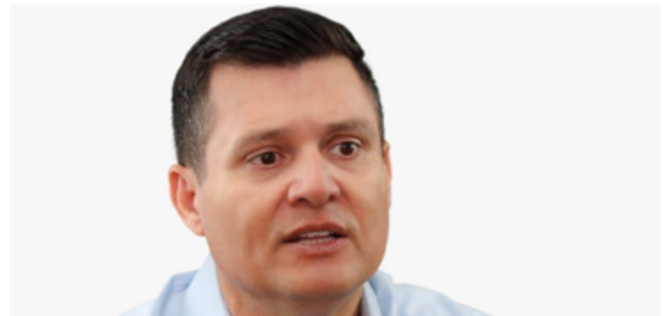
Flávio Pagotto: empresário e político