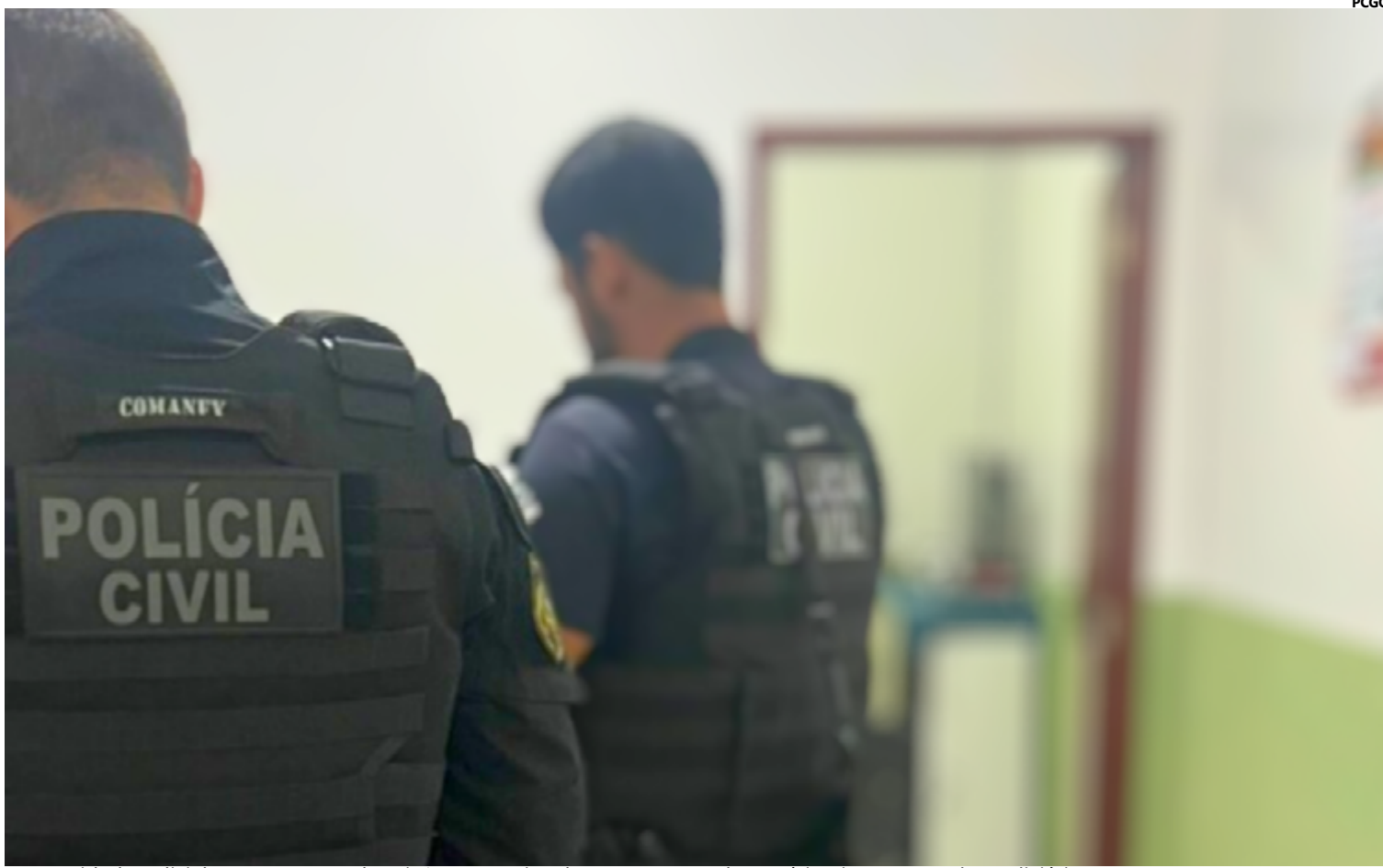
A Autoridade Policial representou pela prisão preventiva dos coautores e do partícipe junto ao Poder Judiciário

A investigação do crime foi conduzida pelos grupos especializados da Polícia Civil em Cristalina, que realizaram diversas atividades de inteligência e trabalho de campo para identificar os responsáveis pelo ataque. Com base nas evidências coletadas, foi possível identificar dois coautores e um partícipe envolvidos no crime.