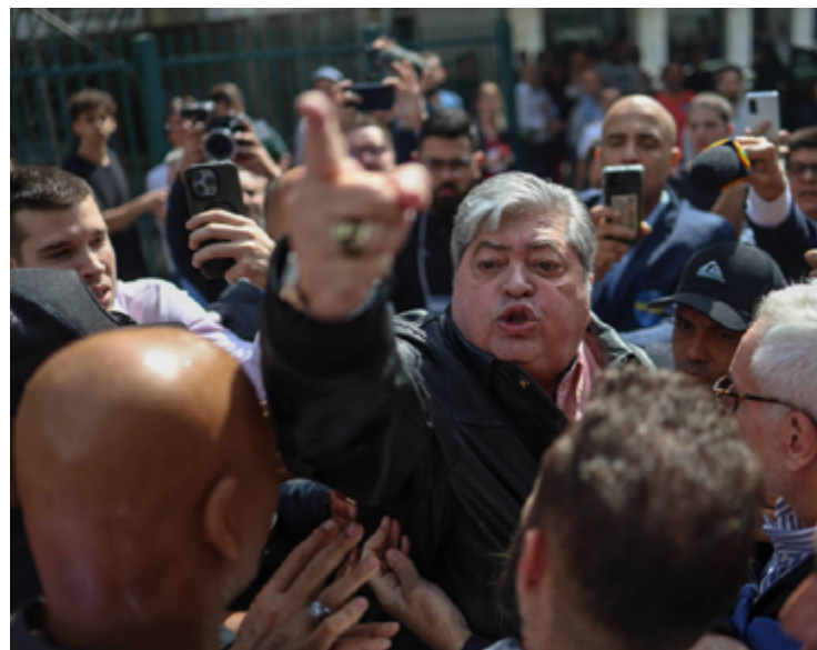
José Luiz Datena critica tucanos que defendem o prefeito Ricardo Nunes

Em diversos momentos, o apresentador insinuou, ressaltando que ainda cabe investigação, haver ligação entre os tucanos opositores e Nunes e também ao crime organizado. “Isso é misturado a bandidos que estão querendo manter o crime organizado no poder. [...] Nem sei se tem gente do PCC misturada aqui, fazendo baderna.”